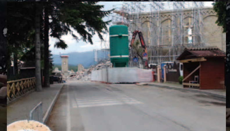
L'arrivo a Amatrice. Superfluo ogni commento.

E ora, con un poco di consapevolezza in più, possiamo augurare Buon Torneo a tutti.