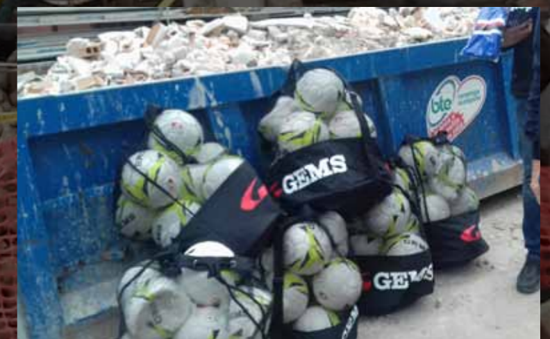
I nostri palloni hanno portato fortuna, il giorno seguente la Prima Squadra dell'Amatrice ha vinto. Speriamo continuino a portarne a tutta la città